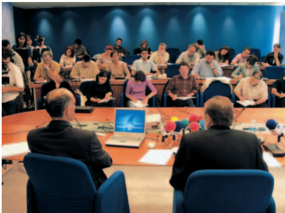
Rueda de prensa en la que se presentó la Memoria Socioeconómica 2001.

La Comisión de Trabajo encargada de su elaboración decidió dar a este informe un tratamiento especial con motivo de su quinta edición. Así, la Memoria 2001