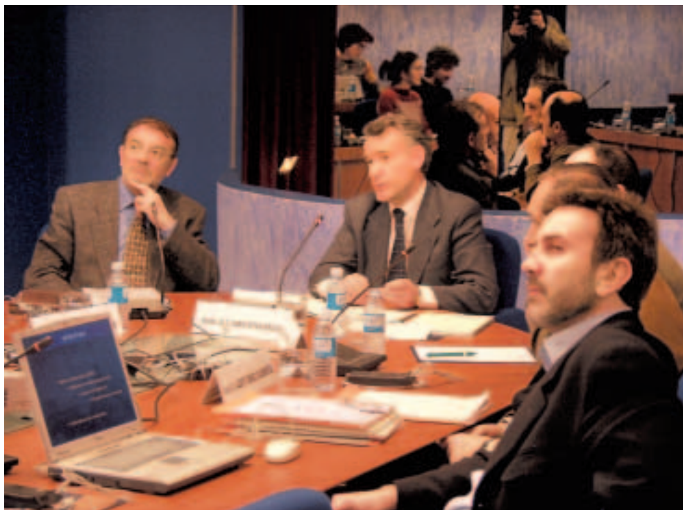
El Consejero de Medio Ambiente y Ordenación del Territorio durante su comparecencia.

una ronda de consultas para conocer la opinión de los colectivos directamente afectados por el anteproyecto de ley sometido a debate.