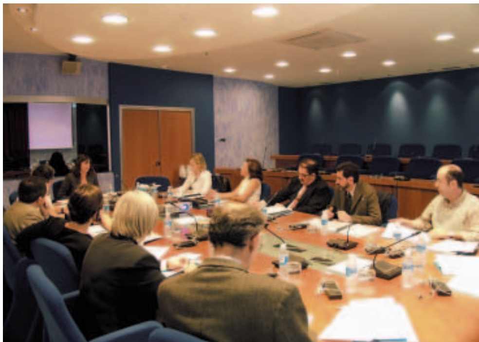
“Auzolan”: Expertos comparecen ante la Comisión Social del CES Vasco.