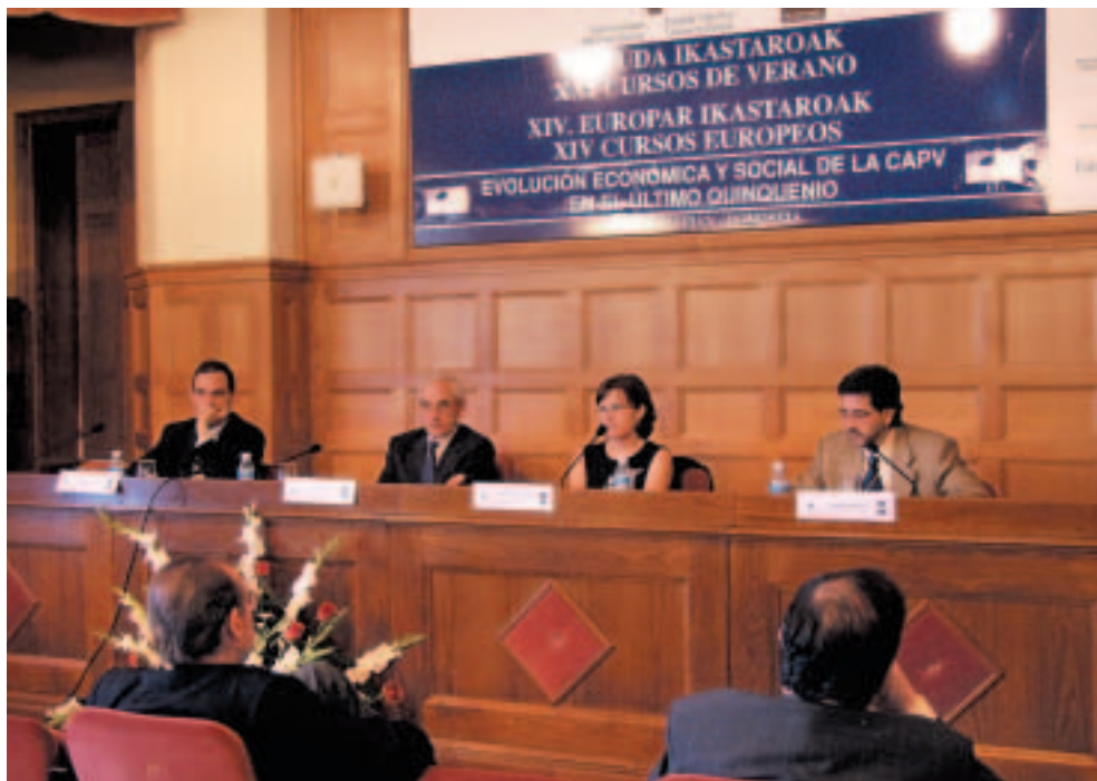
Mesa Redonda 3: "Evolución del Mercado de Trabajo en la CAPV".