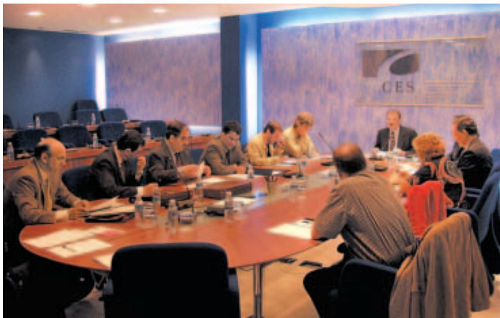
Sesión de trabajo de la Comisión Permanente.