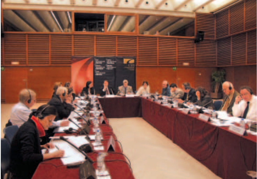
Máximos responsables de los Consejos Económicos y Sociales del Arco Atlántico en la reunión celebrada en el Palacio Kursaal de Donostia.