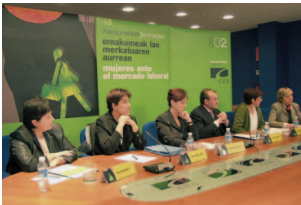
Imagen de la rueda de prensa ofrecida con motivo de la jornada.