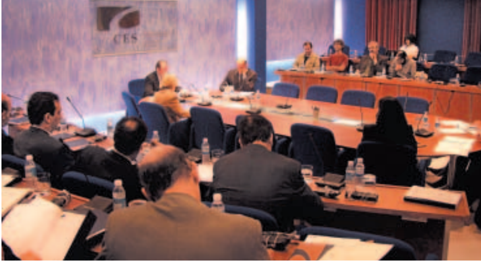
Sesión ordinaria del Pleno del Consejo Económico y Social Vasco.

Durante 2002 se produjeron las siguientes sustituciones :