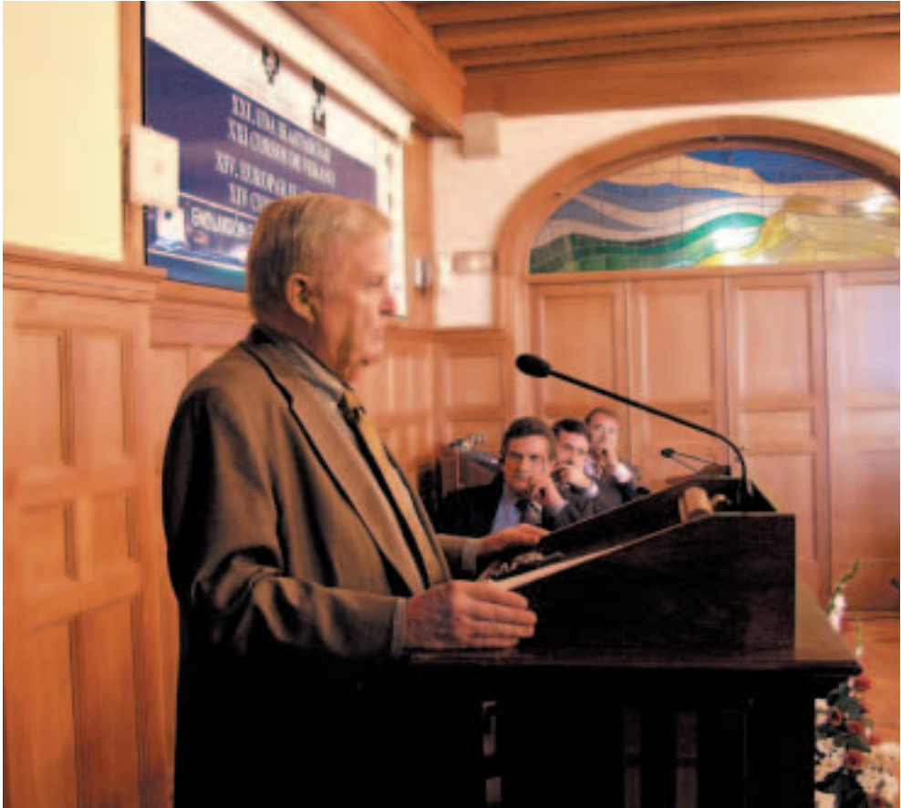
El premio Nobel de Economía Robert Mundell en la conferencia de apertura.