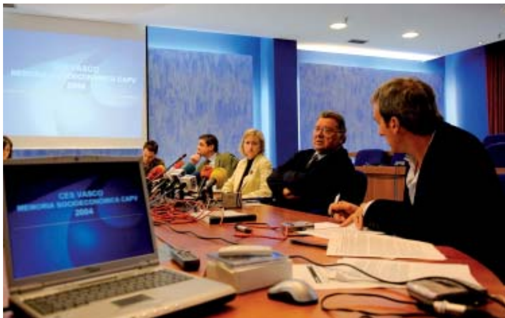
Presentación a la prensa: 18 de octubre de 2005