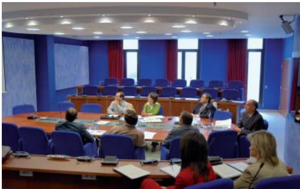
Imagen de la sesión de la Comisión de desarrollo económico celebrada el 4 de mayo de 2005