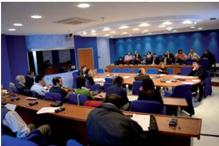
Sesión ordinaria del Pleno del Consejo Económico y Social Vasco