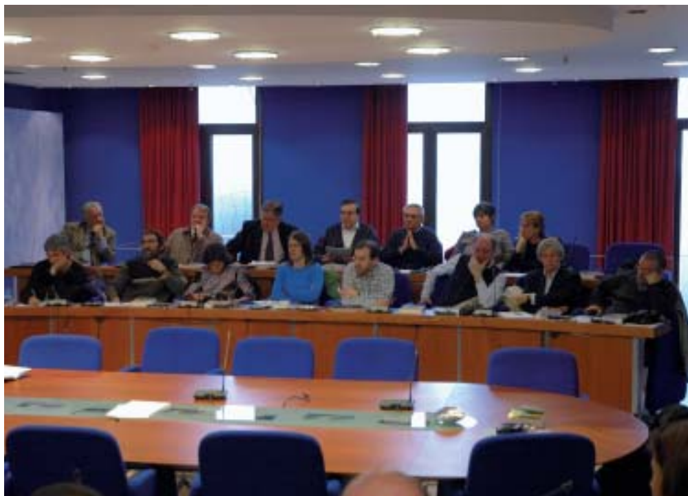
Imagen de la sesión del Pleno, de 8 abril de 2005