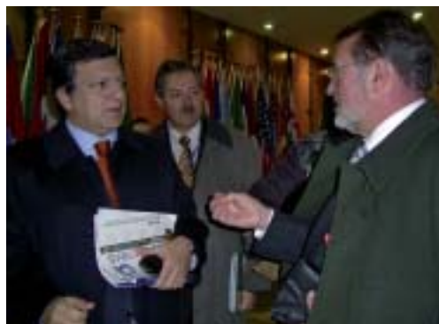
El Presidente de la RTA entrega un ejemplar de la Newsletter al Presidente de la Comisión Europea, Durao Barroso