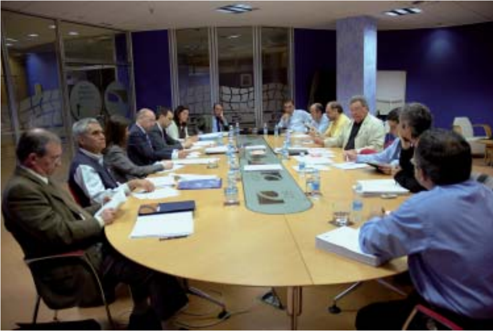
Imagen de la sesión de la Comisión Permanente, 4 de mayo de 2005