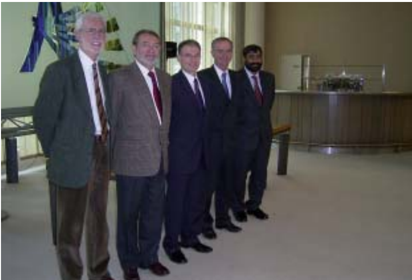
El Presidente de la RTA, Rafael Puntonet, posa junto con los vicepresidentes de Francia, Gran Bretaña y Portugal

El CES Vasco es miembro de la Plataforma de Consejos Económicos y Sociales, y organizaciones análogas de las regiones del Espacio Atlántico, denominada Red Transnacional Atlántica. Su objetivo es la propuesta de proyectos y políticas de cooperación interregional que refuercen la competitividad y la cohesión social y territorial de las regiones atlánticas, así como el estudio y análisis de los asuntos de interés común de adscripción atlántica, y su posterior divulgación y elevación a las instancias decisorias pertinentes, particularmente a la Unión Europea. También forman parte de la Red los Consejos Económicos y Sociales de Cantabria, Galicia, Canarias, Ceuta, Aquitania, Poitou-Charentes, Bretaña, Pays-de-la-Loire, Bretaña, Limousin y de la Región Centro, los Foros Económicos del País de Gales, la Asociación Empresarial de la Región de Lisboa, AERLIS, el Instituto de Soldadura e Qualidade, ISQ, y la Unión de Sindicatos del Algarve, USALGARVE/CGTP-IN.