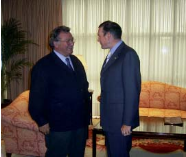
El Lehendakari del Gobierno Vasco da la bienvenida al presidente del CES Vasco

Encuentro institucional con el Lehendakari del Gobierno Vasco .